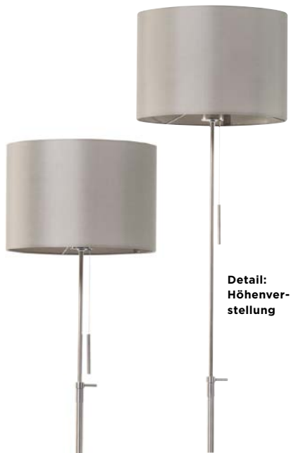
Detail: Höhenver- stellung