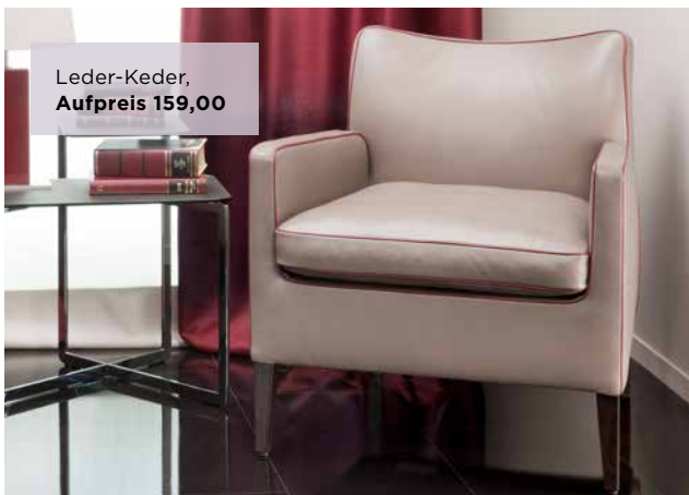
Leder-Keder, Aufpreis 159,00