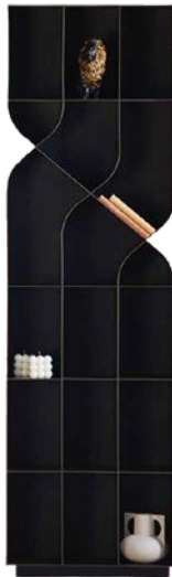
SHELF Solitärmöbel-Serie Metallkorpus, Furnier Sockel oder wandhängend ab 1.413,00 €