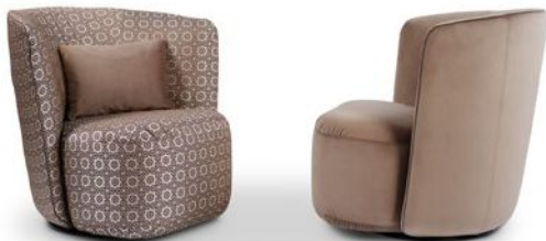
OPHELIA Sessel in Stoff und/oder Leder ab 1.235,00 €