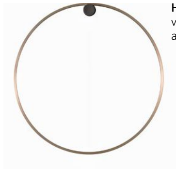
HOLY Wandleuchte verschiedene Oberflächen ab 711,00 €