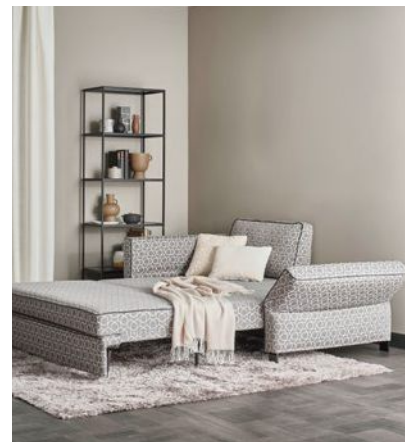
hinten: CAMEO CONSTRUCTION Regalsystem individuelle Maße ab 800,00 €