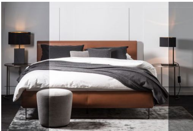
PLAISIR Polsterbett in Stoff oder Leder ab 1.515,00 €