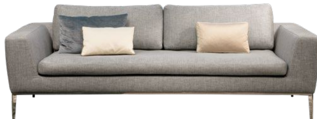
LORD Sofa in Stoff oder Leder ab 2.052,00 €