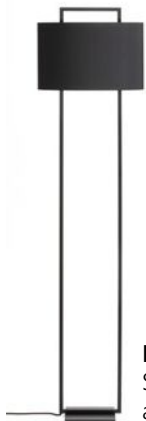
PHAROS Stehleuchte Seidenschirm ab 982,00 €