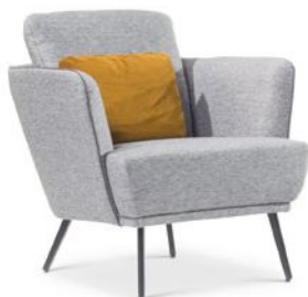
NONA Sessel in Stoff oder Leder ab 1.550,00 €