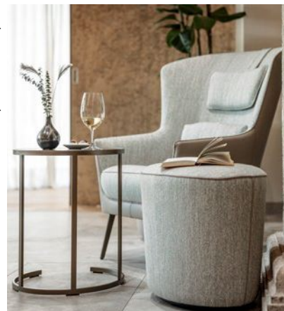
CAMEO BT verschiedene Ober- flächen ab 399,00 €