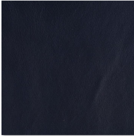
38 NIGHT BLUE