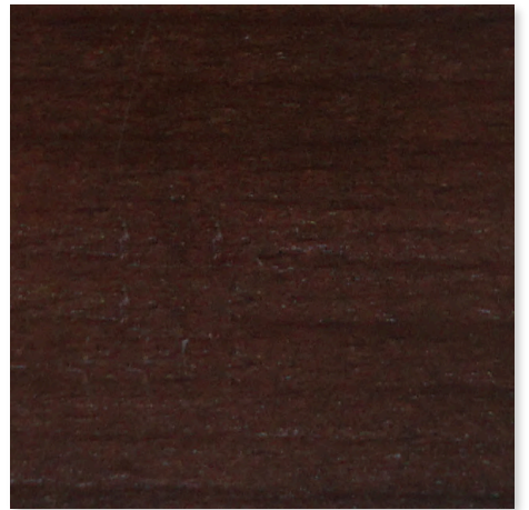
EICHE DUNKEL HOLZBEIZTON