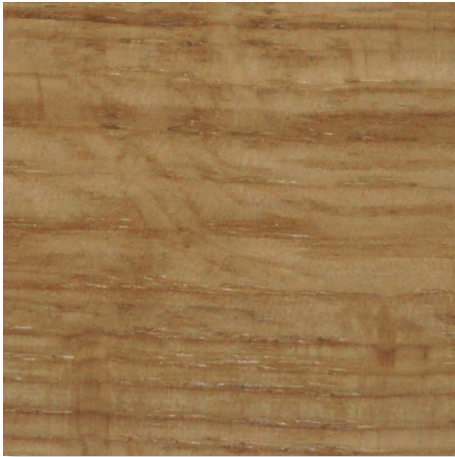
EICHE MASSIV NATUR HOLZBEIZTON

Die Holz-Beiztöne und -Farben sind zutreffend für die Fussgestelle und Möbelfüsse der folgenden Möbelserien: