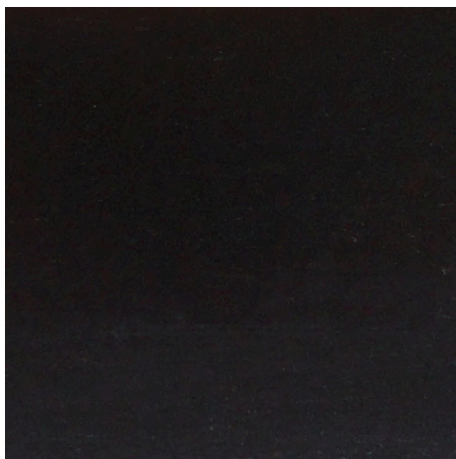
SCHWARZ HOLZ LACKIERT