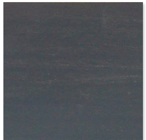
SCHIEFERGRAU HOLZ LACKIERT