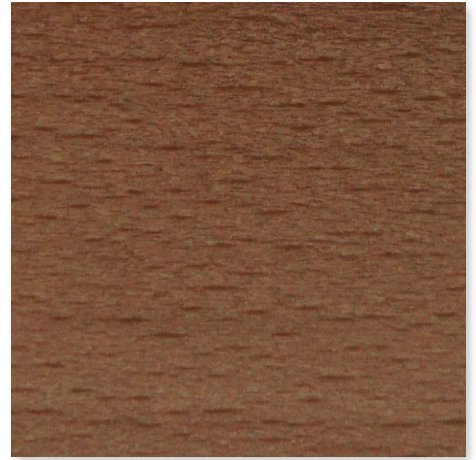
NUSSBAUM EUROPÄISCH HOLZBEIZTON