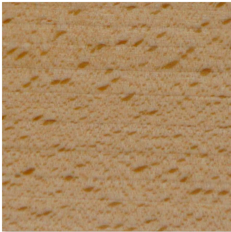
BUCHE NATUR HOLZBEIZTON