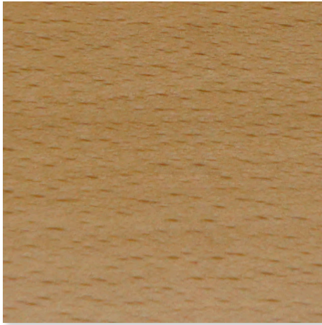
KIRSCHBAUM AMERIKANISCH HOLZBEIZTON