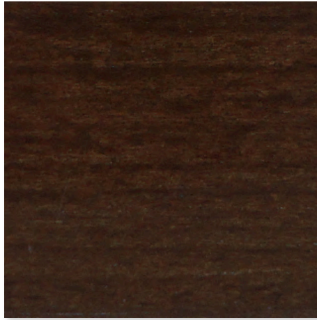
WALNUSS NATUR HOLZBEIZTON